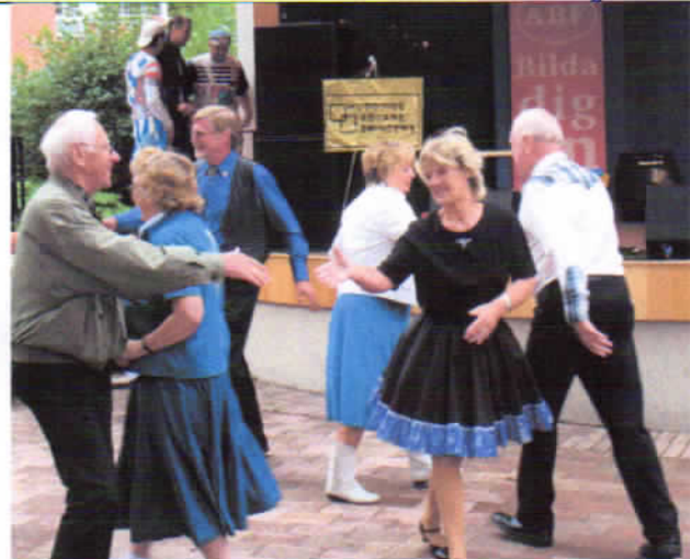
Från uppvisningsdansen vid Huddingedagarna 2009