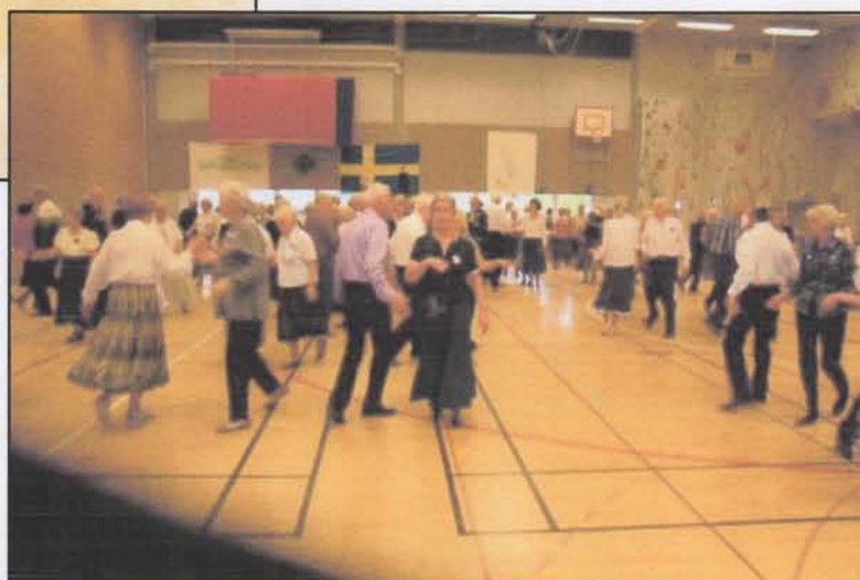
Bilder från dansen 2010 Arbetslaget och dansare