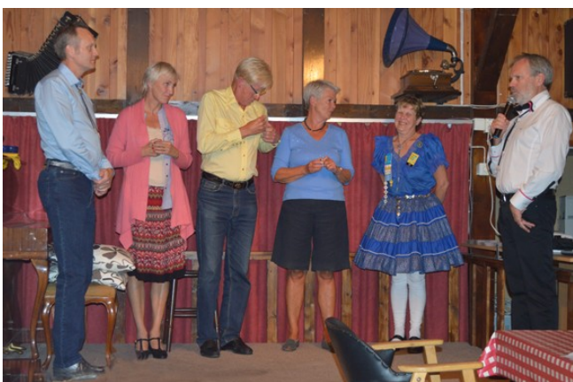
(Bilden. Utmärkelse för 5:e och 10:e gången på Bödabaden)

Böda är ett begrepp inom svensk squaredans sedan långt tillbaka i tiden. Det är i själva verket en institution. Många dansare har varit där. Våldigt många! Inte en gång! Utan massor av gånger.