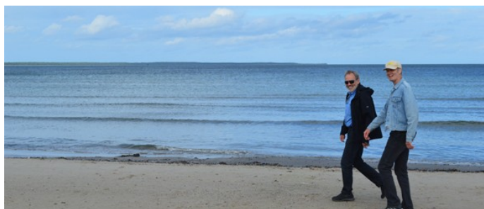
(Bilden. Två callers på drift)